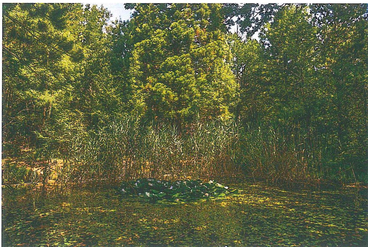
4. Кувшинки в пруду Бабу-Корыто