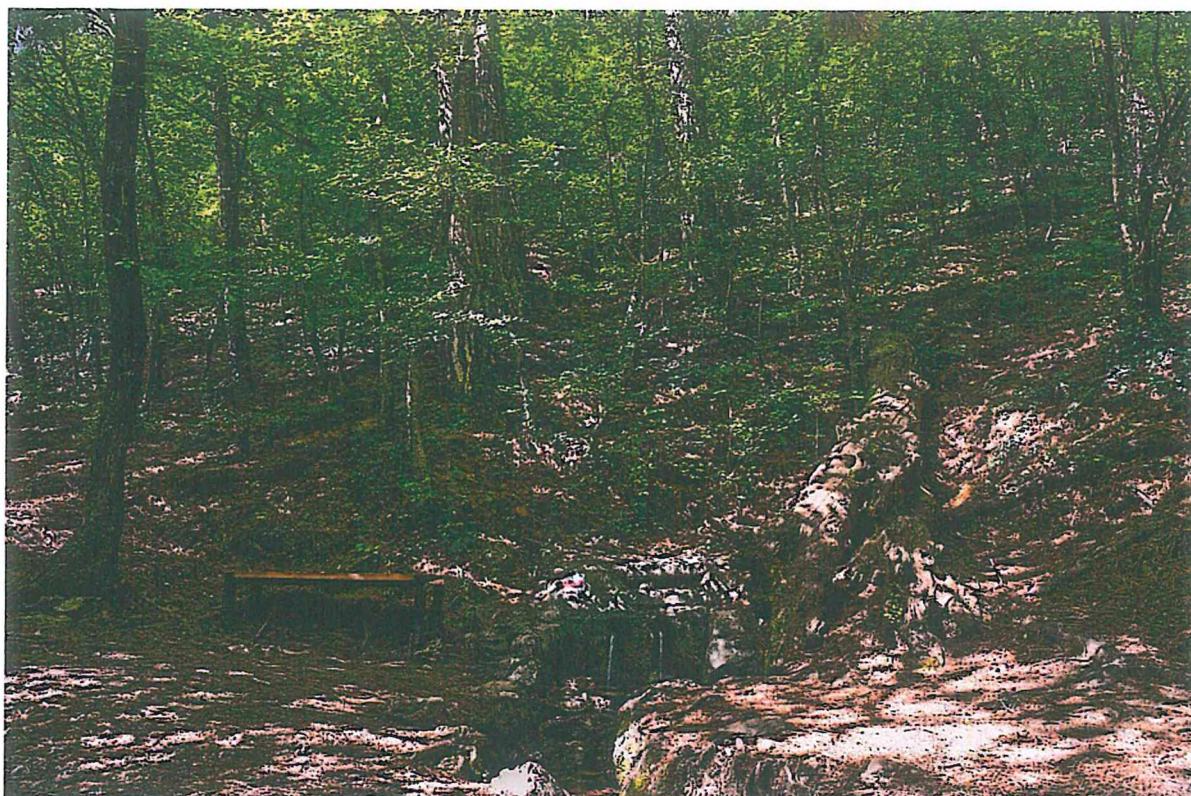
1. Скамейка возле родника Бабу-Корыто (автор: Балахтинова Ю.С.)