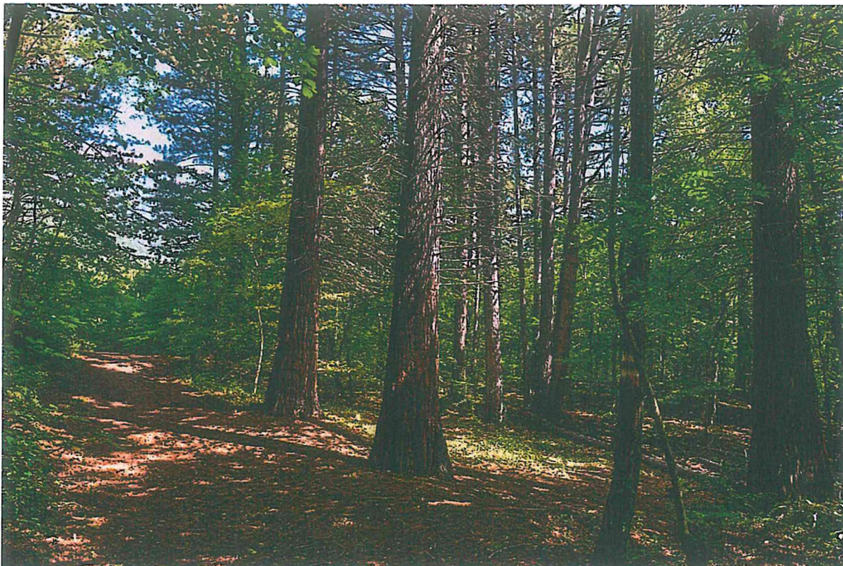
3. Роща секвойядендронов у пруда Бабу-Корыто